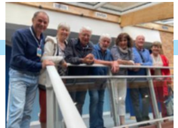
Le Caméra Club Annecy à Soulac