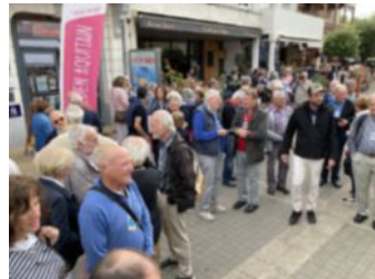
Les entractes devant le cinéma Océanik