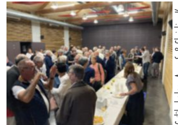
Le verre de clôture du Festival National